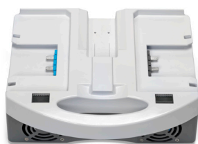
i-charge 9 (3 styk)