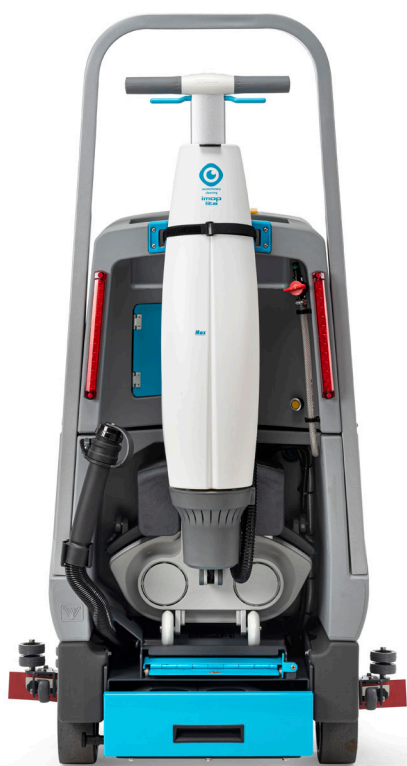
i-drive + imop Lite