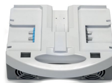
i-charge 9 (3 stk.)