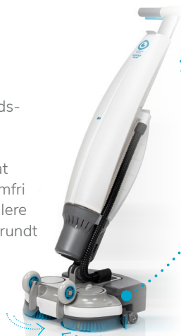
500 omdrejninger pr. minut

Med imop Lite får du en højhastigheds-skrubbemaskine med to børster og et arbejdsområde på 37 cm med uovertruffen smidighed. De to modsat roterende børster giver dig en problemfri oplevelse og gør det muligt at kontrollere maskinen selv med én hånd. Rengør rundt om og neden under ting, præcis som med en moppe, bare med meget bedre rengøringsresultat.