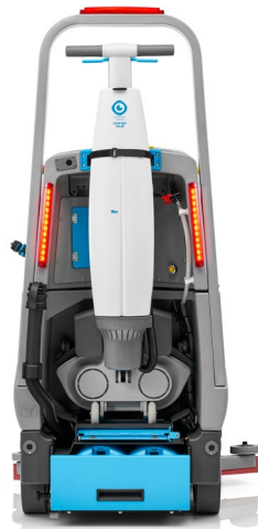
i-drive + imop Lite